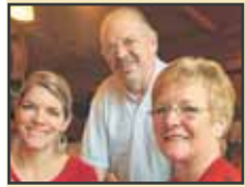
La fondue, c'est tellement convivial...