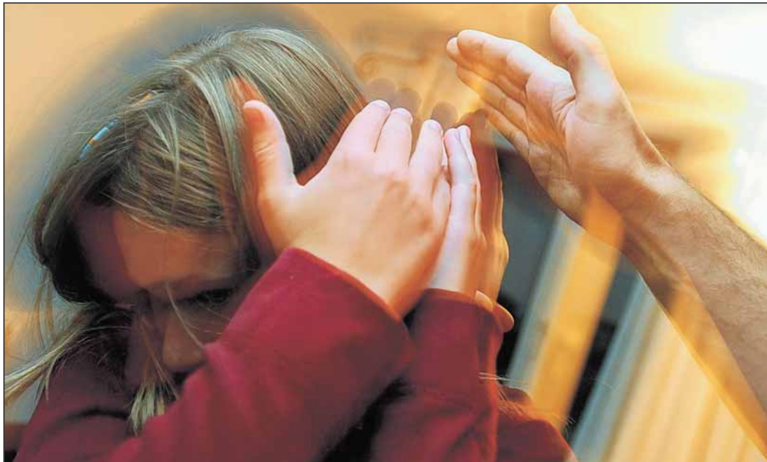
C'est après une dispute finie dans les larmes et les fractures que l'ancien cogneur a eu le déclic pour se reprendre en main.

VIOLENCE • Après avoir brutalisé sa compagne, il a sollicité l'aide de l'association EX-expression, qui s'adresse aux auteurs d'actes violents. Aujourd'hui, il témoigne.